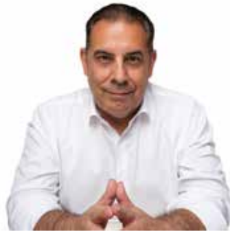
JOSEP MASDEU ISERN ALCALDE DE LA SELVA DEL CAMP