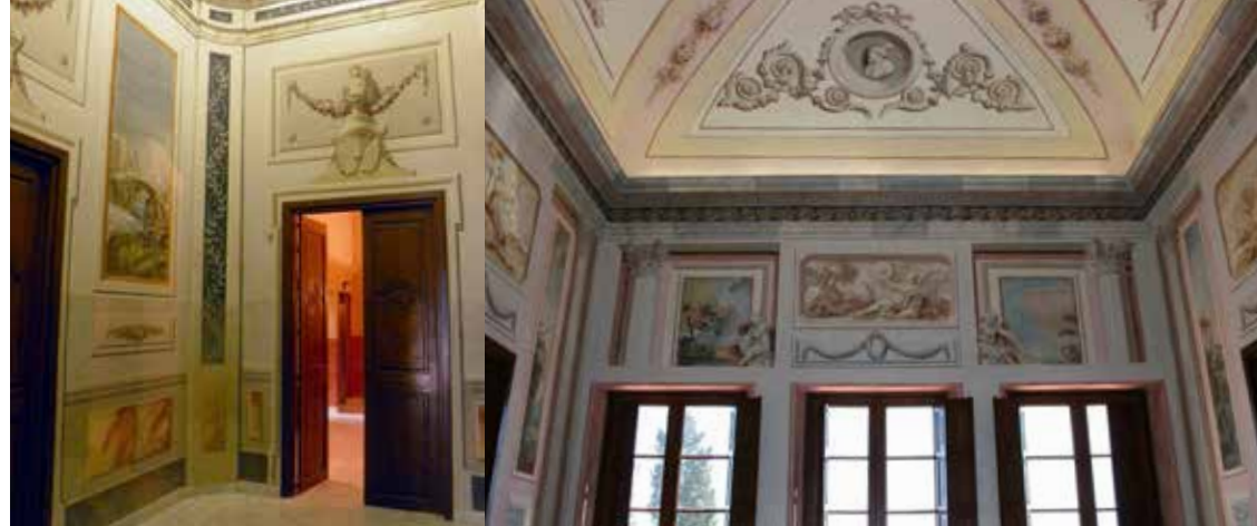
Les estances nobles del Mas estan decorades amb pintures al tremp alternant motius mitològics amb d'altres de religiosos.

El rebedor conté escenes representant cada una de les quatre estacions i unes al·lusions a les arts i a la volta podem contemplar escenes mitològiques: els déus