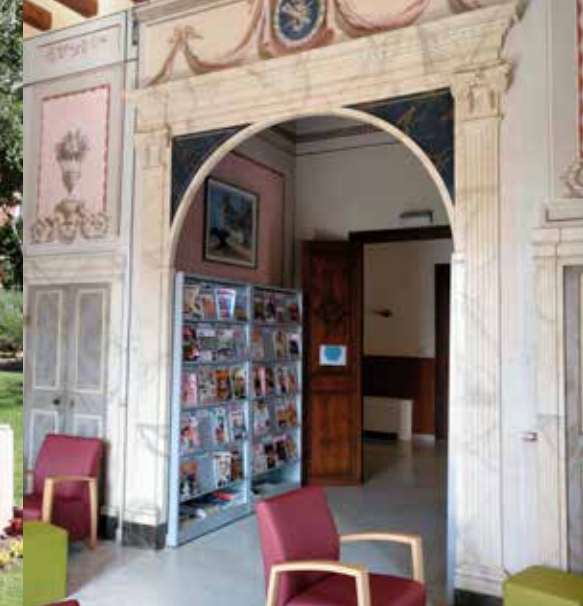
El Mas d'Iglésies acull, entre d'altres, a Biblioteca i l'Arxiu municipals.