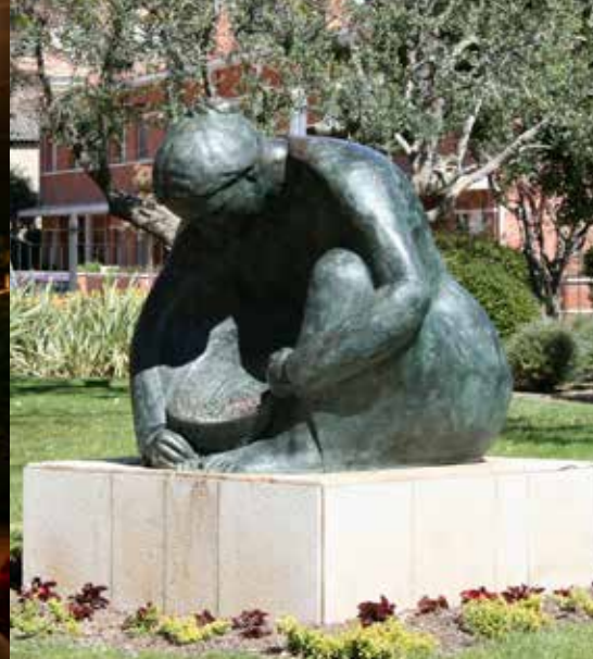
La Plegadora d'avellanes, escultura en bronze d'A. Martí (1996).