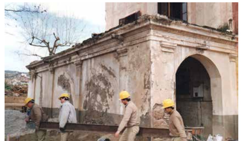
Per reformar i adaptar el mas a usos municipals, es creà una escola taller amb mòduls de construcció i jardineria.

Per tal d'ordenar tot aquest nou espai públic, l'Ajuntament creà una escola taller amb mòduls de construcció, electricitat, fusteria i jardineria que es dedicà a la restauració de l'edifici i dels jardins, molt abandonats, i que donà feina inicial a una quarantena de joves.