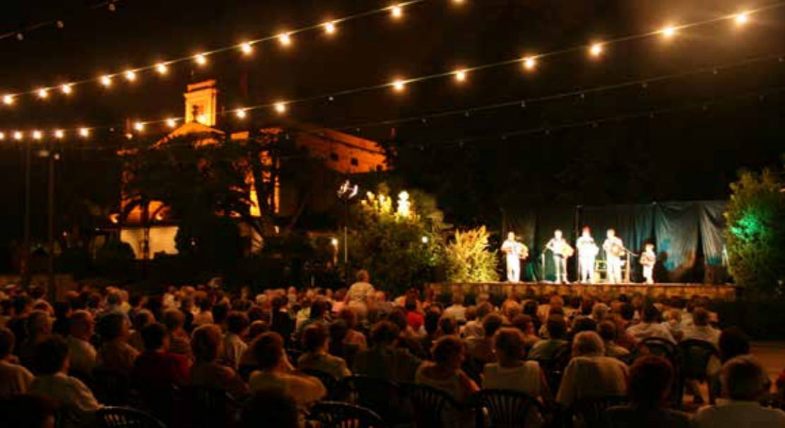
Els jardins de l'Hort d'Iglésies s'han convertit en un lloc ideal per a usos col·lectius de lleure i esbarjo.