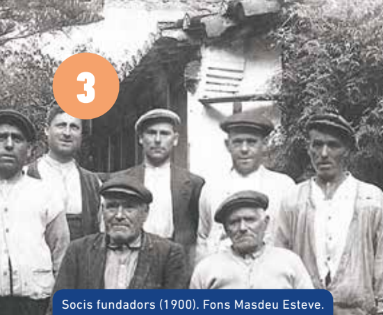
Socis fundadors (1900). Fons Masdeu Esteve.