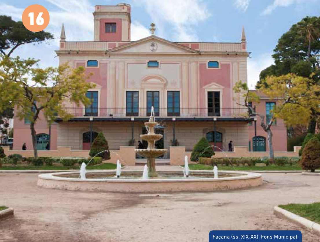
Façana (ss. XIX-XX).