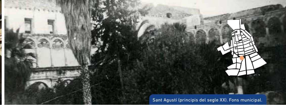
Sant Agustí (principis del segle XX). Fons municipal.