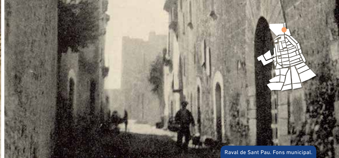
Raval de Sant Pau. Fons municipal.