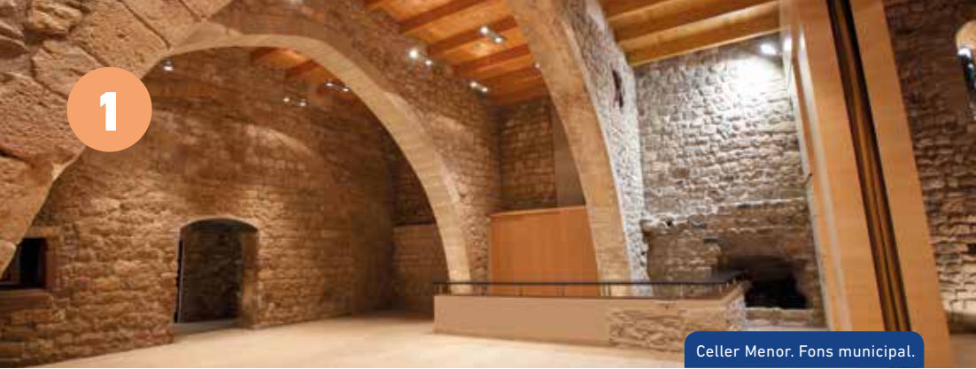
Celler Menor. Fons municipal.