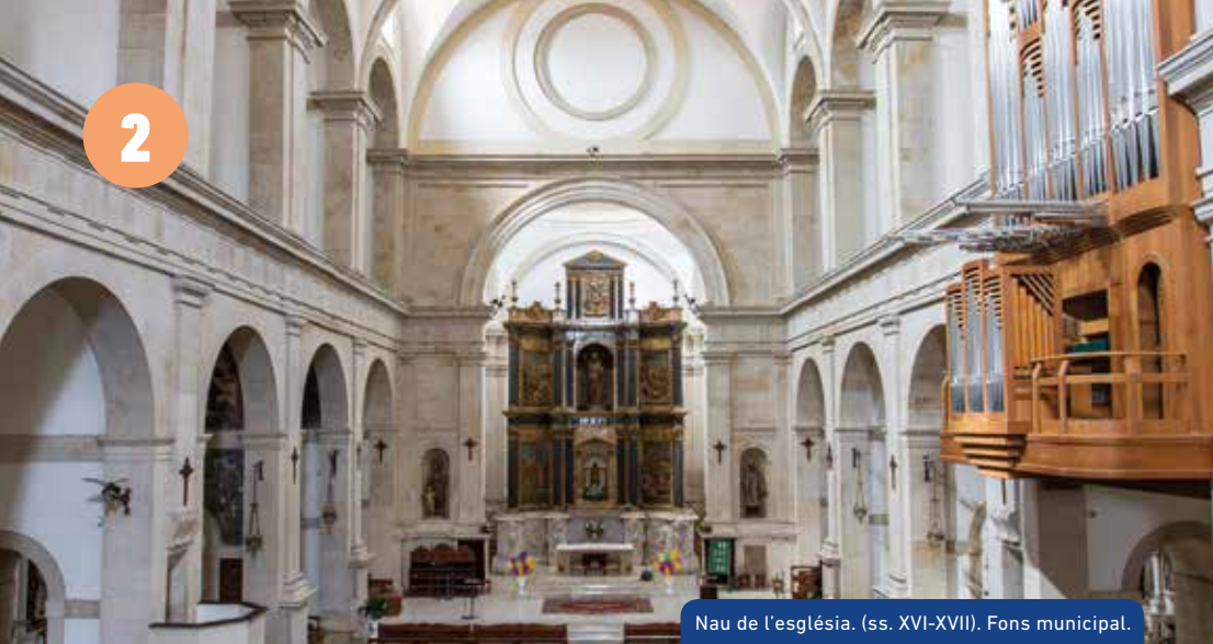
Nau de l'església. (ss. XVI-XVII). Fons municipal.