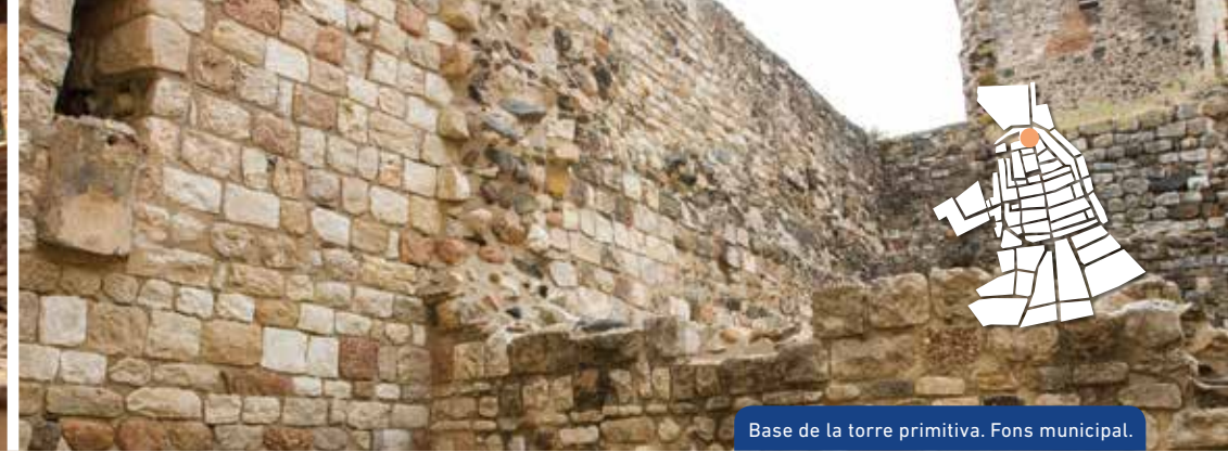
Base de la torre primitiva. Fons municipal.