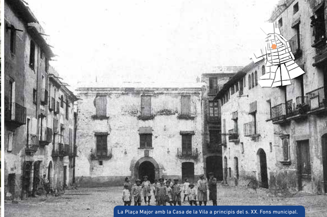
La Plaça Major amb la Casa de la Vila a principis del s. XX. Fons municipal.