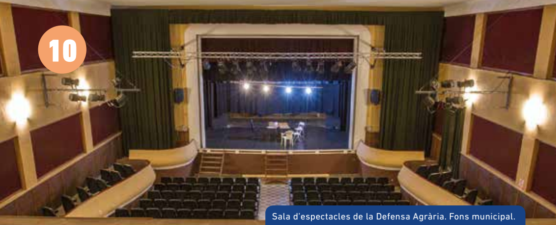
Sala d'espectacles de la Defensa Agrària. Fons municipal.