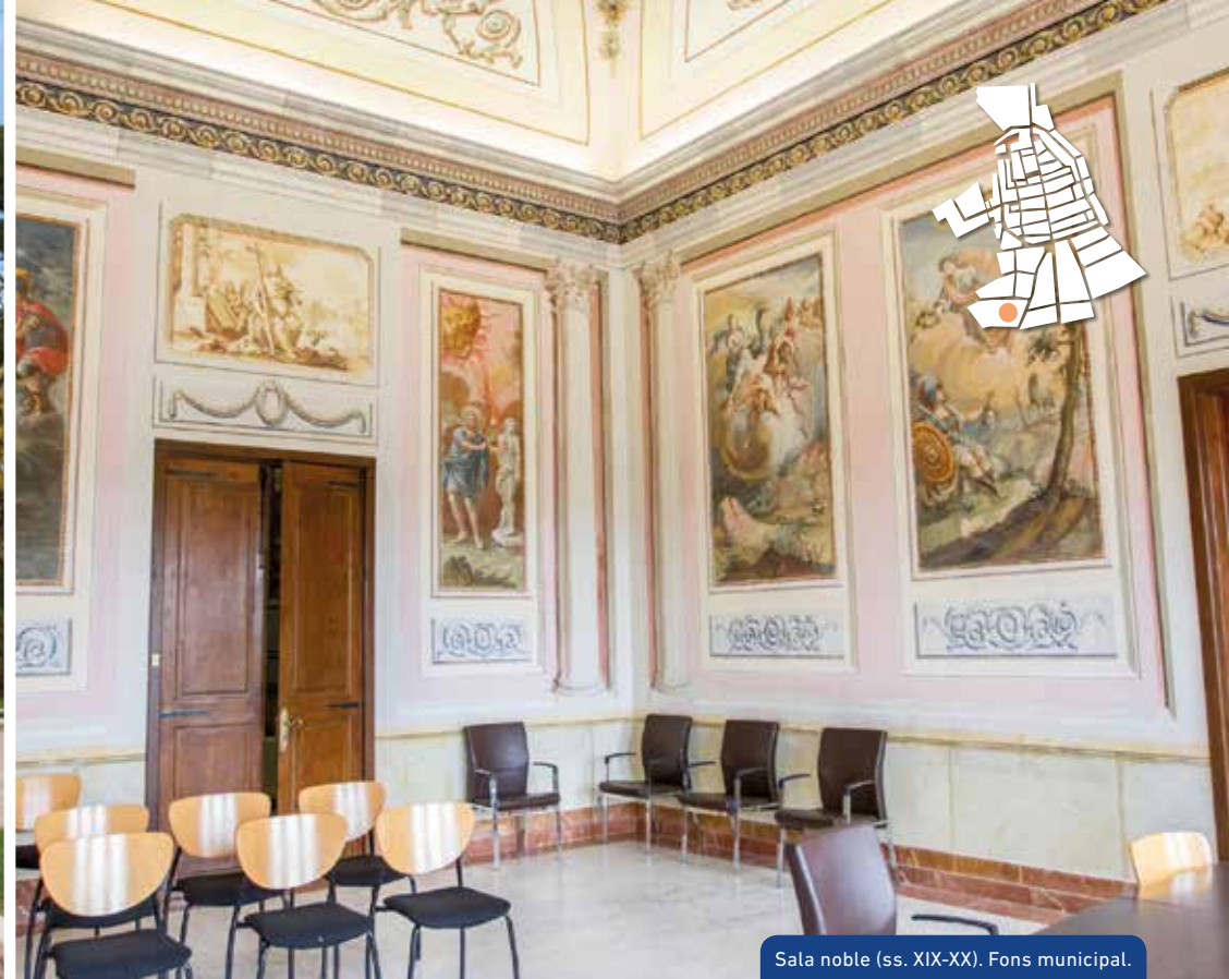
Sala noble (ss. XIX-XX). Fons municipal.