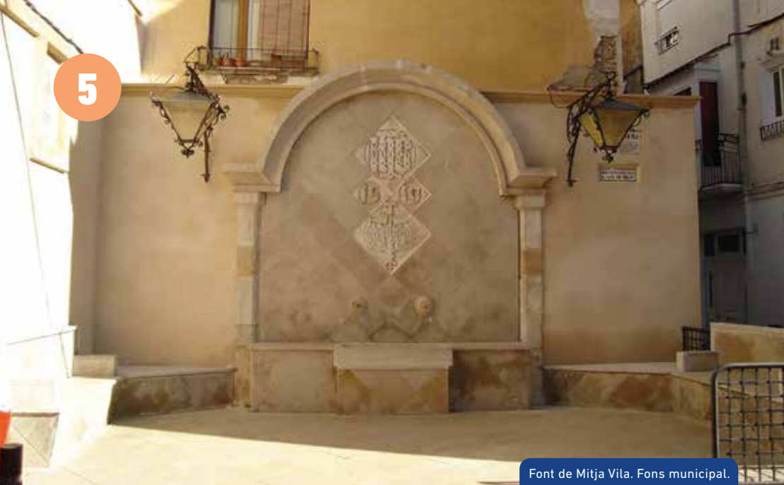
Font de Mitja Vila.