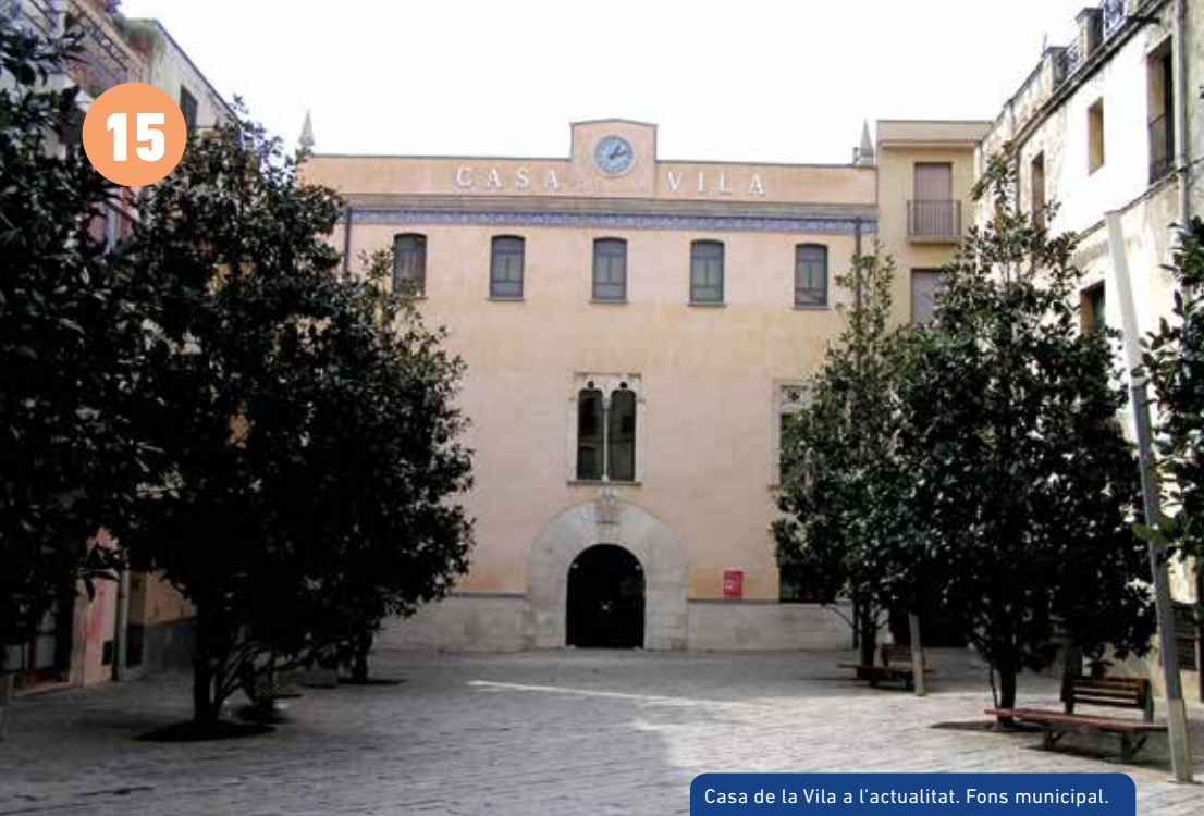
Casa de la Vila a l'actualitat. Fons municipal.