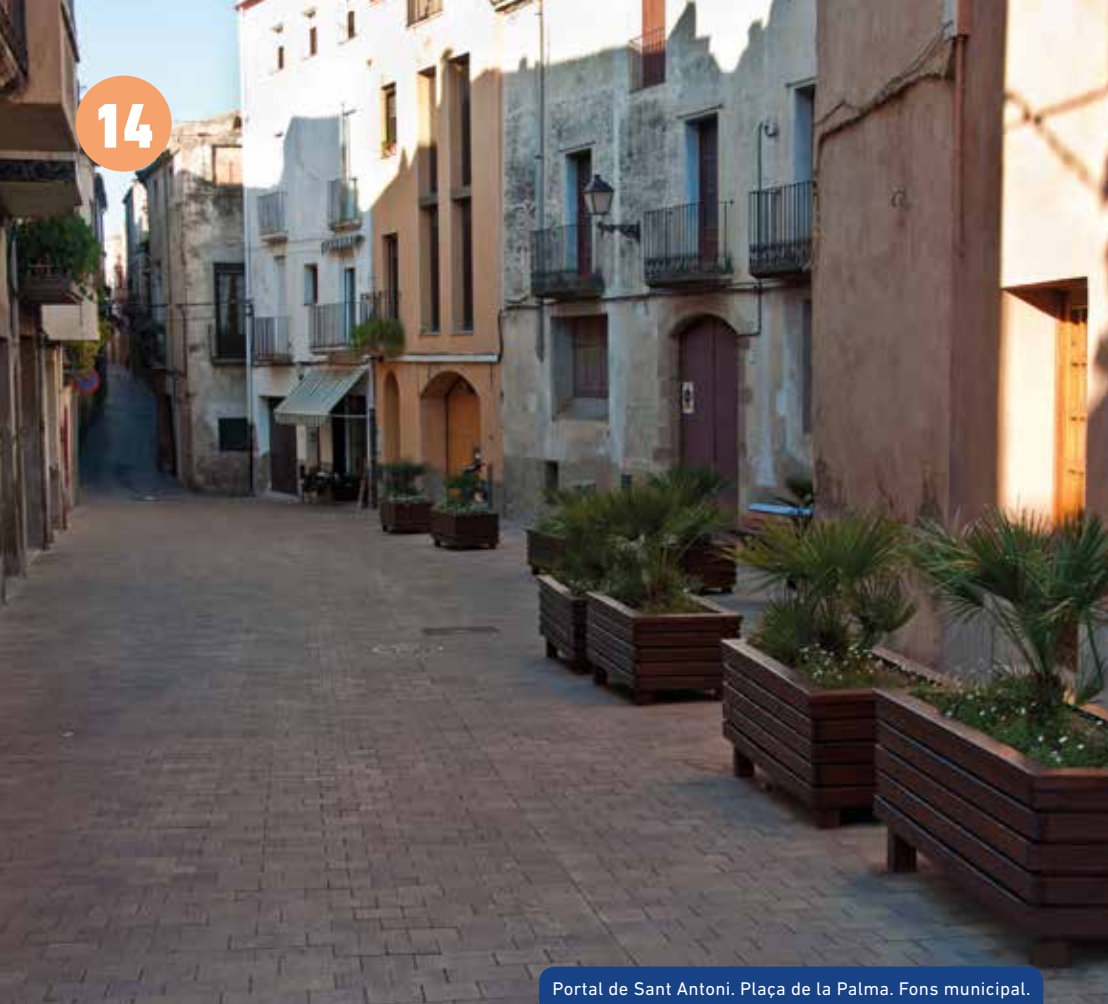
Portal de Sant Antoni. Plaça de la Palma. Fons municipal.