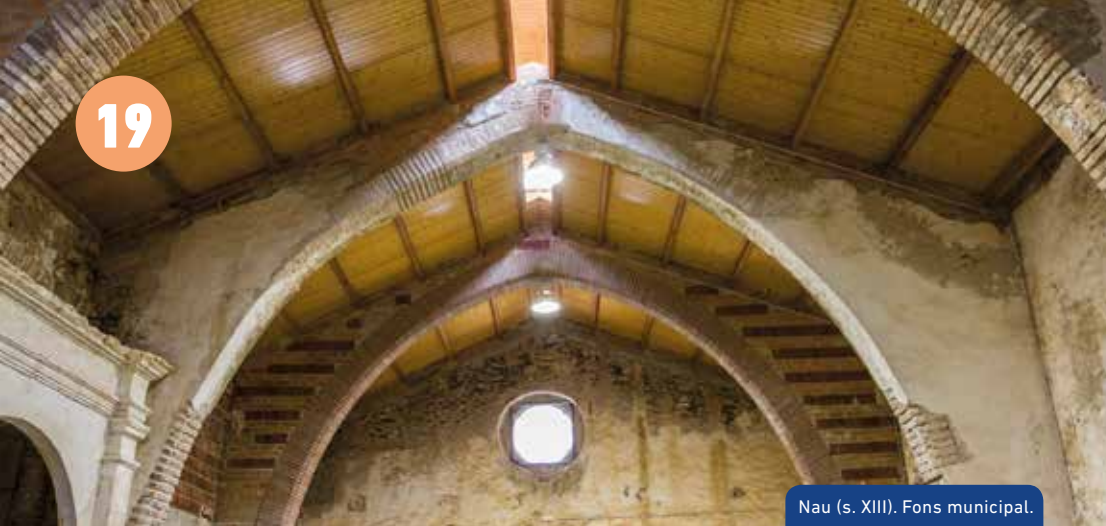
Nau (s. XIII). Fons municipal.