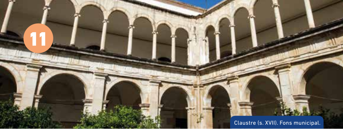
Claustre (s. XVII). Fons municipal.