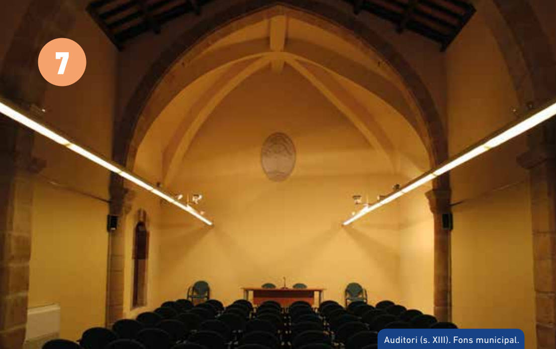
Auditori (s. XIII). Fons municipal.