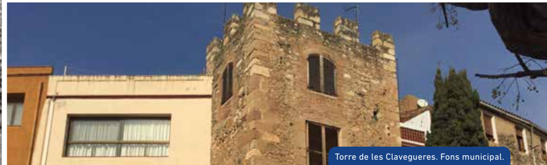
Torre de les Clavegueres. Fons municipal.

For over 850 years of history, the towers have been part of the walled town and their singularity has led to them being given popular nicknames. Notable is the Torre de la Batalla (Tower of the Battle), no longer extant, but documented in the first half of the fourteenth century. It overlooked the final stretch of the town's irrigation channel, standing above the path that climbed the Puig d'en Cama.