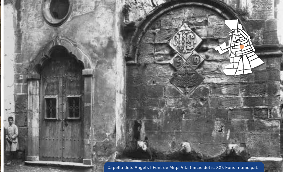
Capella dels Àngels i Font de Mitja Vila (inici del s. XX). Fons municipal.