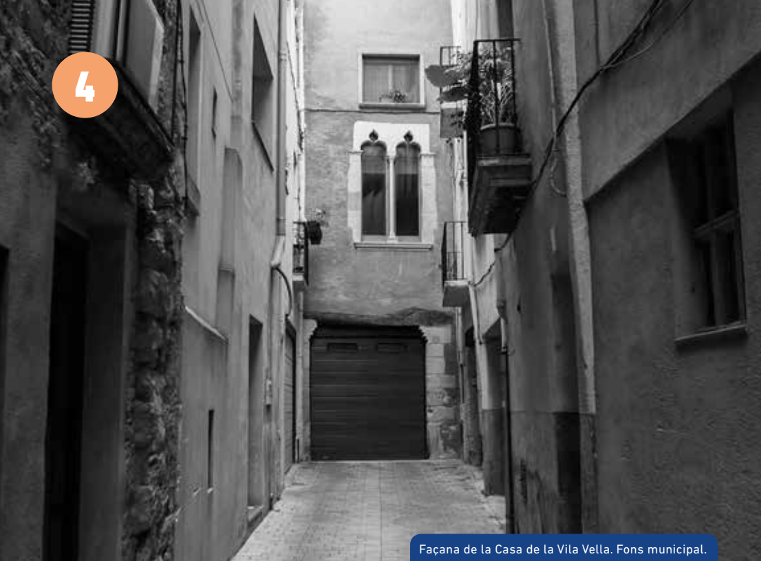
Façana de la Casa de la Vila Vella. Fons municipal.