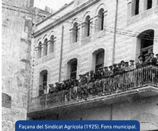
Façana del Sindicat Agrícola (1925). Fons municipal.