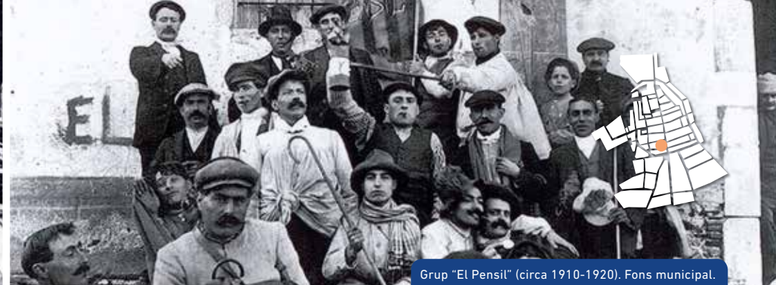
Grup "El Pensil" (circa 1910-1920).