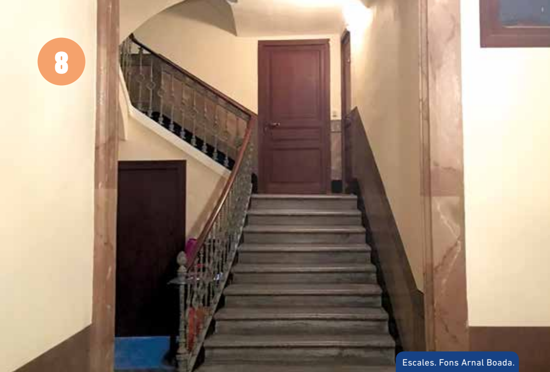
Escales. Fons Arnal Boada.