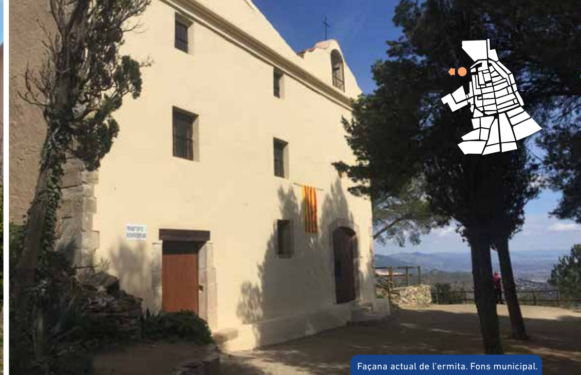
Façana actual de l'ermita. Fons municipal.