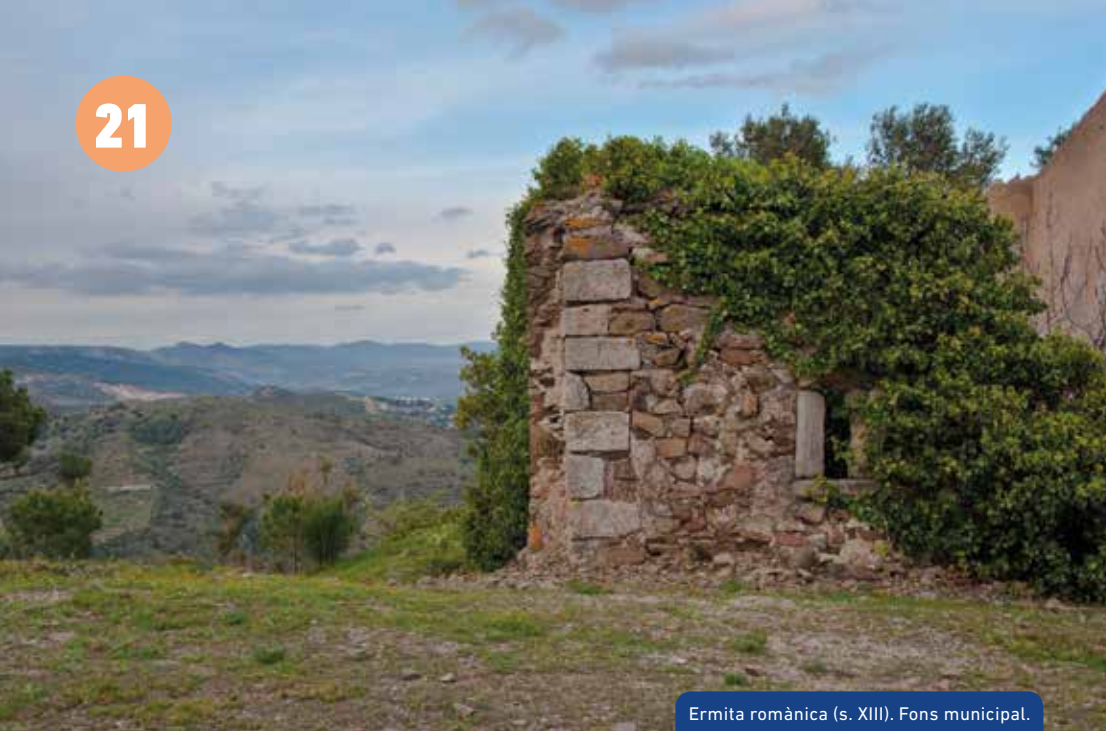
Ermita romànica (s. XIII).