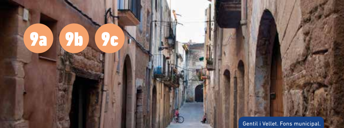
Gentil i Vellet. Fons municipal.