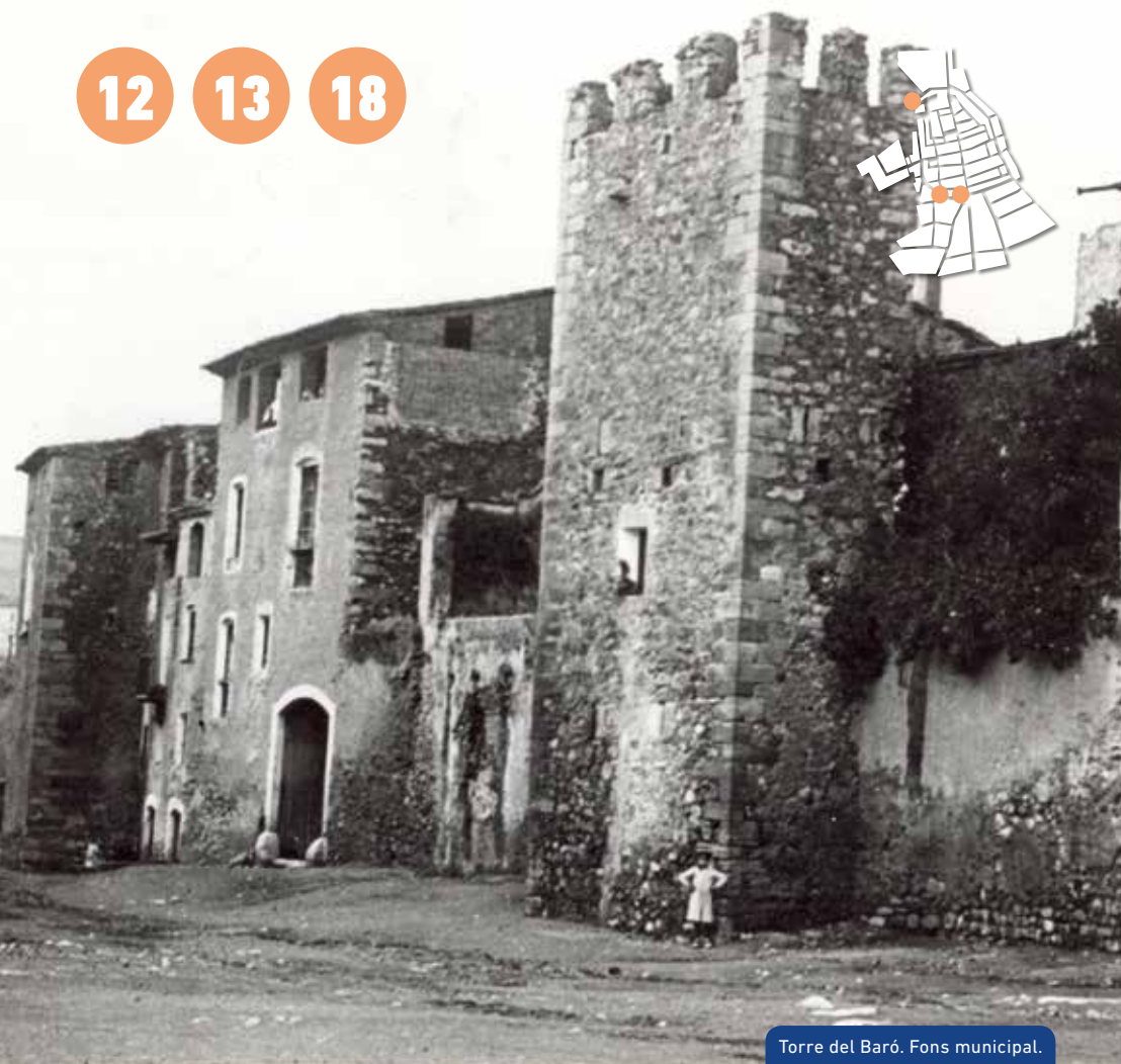
Torre del Baró.