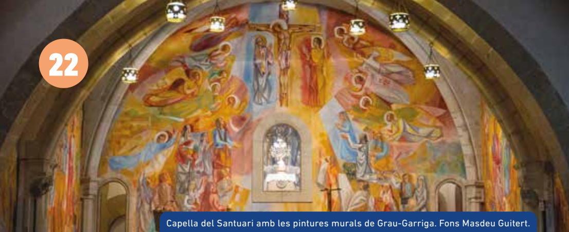
Capella del Santuari amb les pintures murals de Grau-Garriga.