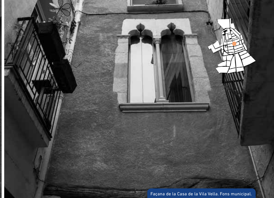
Façana de la Casa de la Vila Vella.