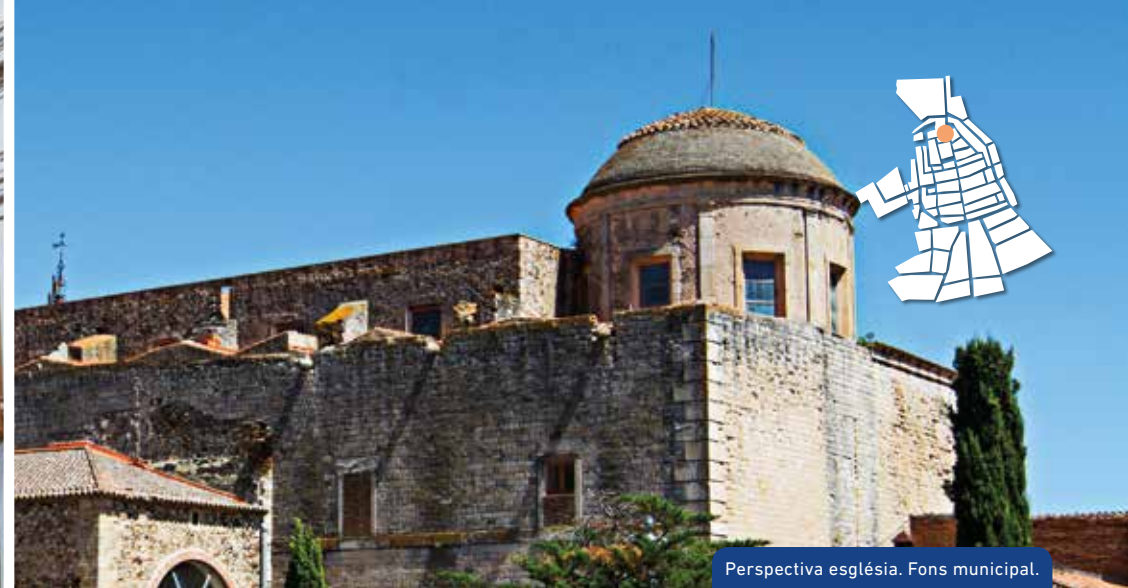
Perspectiva església.