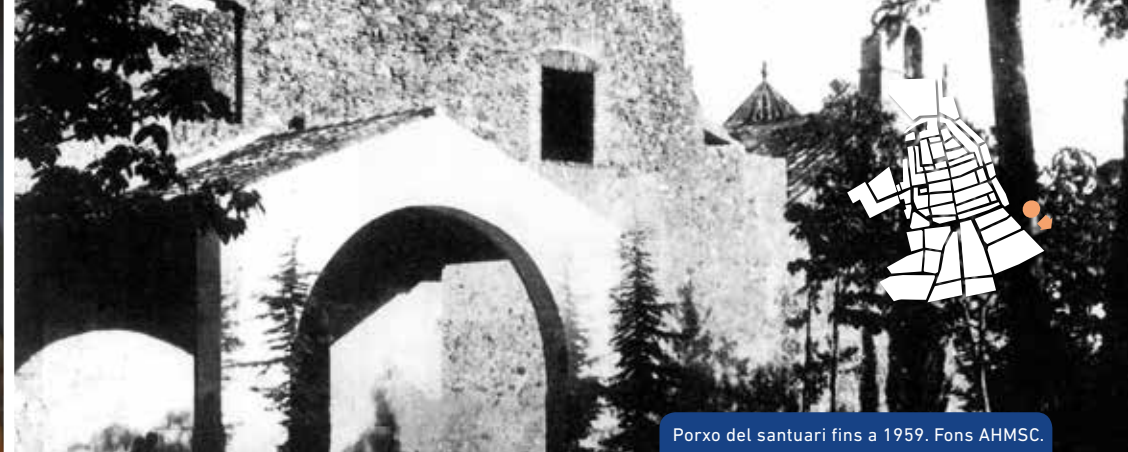
Porxo del santuari fins a 1959.