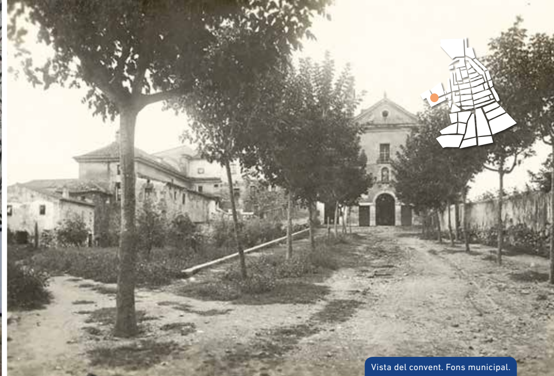
Vista del convent. Fons municipal.