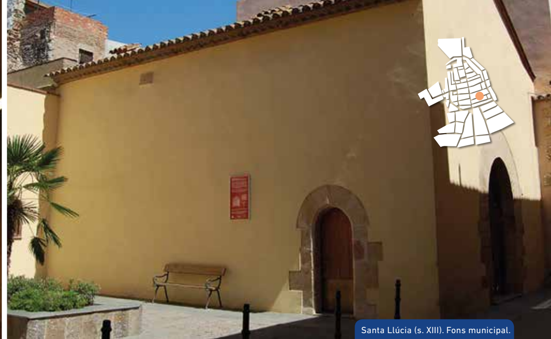
Santa Llúcia (s. XIII). Fons municipal.