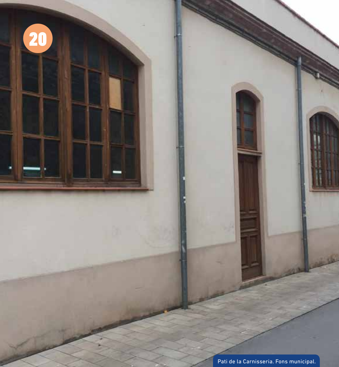
Pati de la Carnisseria. Fons municipal.