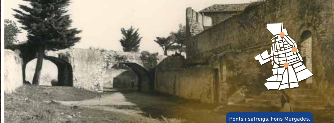
Ponts i safreigs. Fons Murgades.