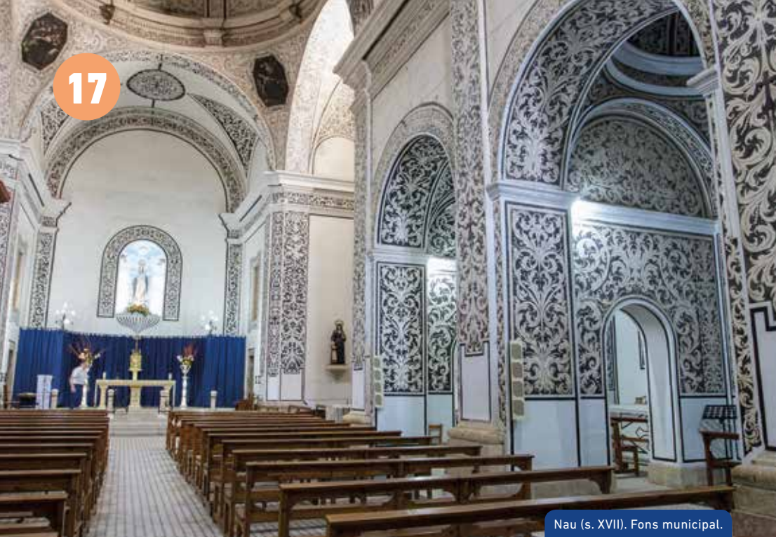
Nau (s. XVII). Fons municipal.