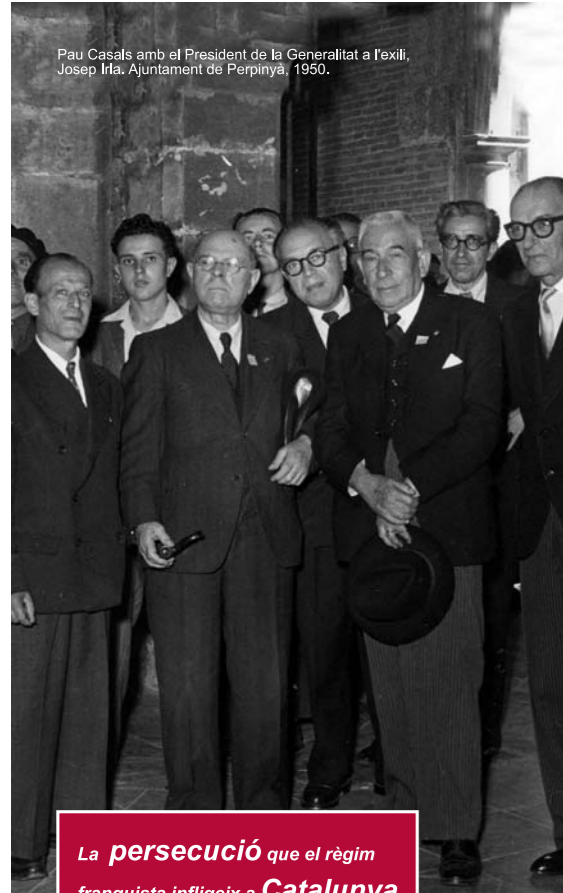
Pau Casals amb el President de la Generalitat a l'exili, Josep Irla. Ajuntament de Perpinyà, 1950.

La persecució que el règim franquista infligeix a Catalunya des de fa setze anys hauria de revoltar totes les consciències del món. La llibertat , com la pau , també és indivisible .