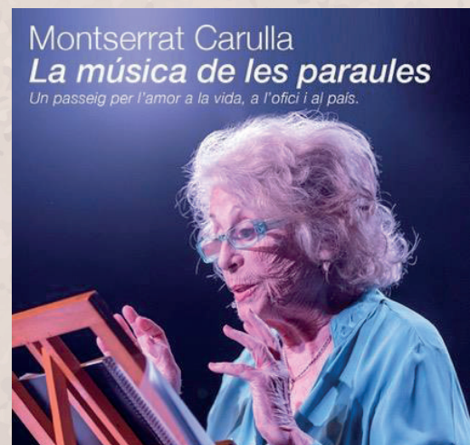
Montserrat Carulla La música de les paraules Un passeig per l'amor a la vida, a l'ofici i al país.